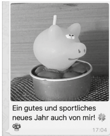
Abb. 1: Nachricht mit Foto.